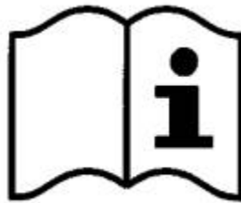
Рисунок 3 - Пиктограмма

а) пиктограмму для указания на то, что пользователь должен прочитать информацию, сообщаемую изготовителем (см. рисунок 3);