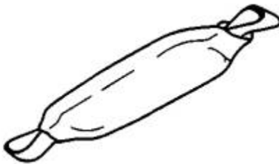
Рисунок 1 - Пример амортизатора как компонента

Если амортизатор является компонентом, испытание динамической нагрузкой проводят, как указано в ЕН 364 (подпункт 5.3.4.1), с жесткой стальной массой 100 кг.