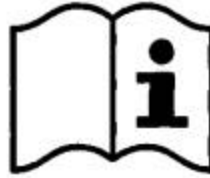
Рисунок 3 - Пиктограмма